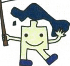
食育推進 しょくいくん

「かわさき健康づくり・食育プラン(第3期川崎市健康増進計画・第5期食育推進計画)(案)への御意見を募集(パブリックコメント)いたします。多くの皆様の御意見をお待ちしております。